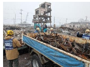
輪島の市場跡の片づけ

車で現地入りできる方は、ボランティアの方用のキャンプ場（有料）を利用するという方法があります。テント泊に抵抗がない方は、金沢市内から往復6時間するよりは、より作業現場の近くに拠点を設けるのが良いと思います。“能登 ボランティア キャンプ場”で検索してみてください。