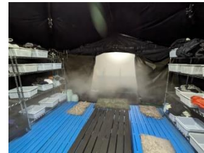
自衛隊風呂の脱衣所案

ボランティアに行く前、ネットに自粛を訴える投稿をみかけました。渋滞する、水道下水が使えないため迷惑というのが理由です。実際に行ってみると、道路に段差があったり迂回路になっていたりとスピードは出せませんが、深刻な渋滞はありません。流れないので排泄物が山になっている公衆トイレがある一方、営業中のコンビニで水洗トイレも使えました。全てという訳ではありません、確実状況は改善しています。