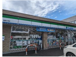
輪島のコンビニ 営業時間要注意

自分が仲間と行った2日間のボランティア活動の気づきをご紹介します。これから行くことを計画中の方の参考になれば幸いです。