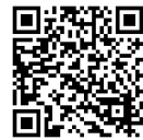
自衛隊風呂の案内

被災地での作業は汚れるし、身体を使います。風呂なしを覚悟していきましたが、自衛隊風呂をボランティアも使えました。入浴者数を隊員さんが管理し、順番に入浴します。とても清潔で、塩素の匂いもなく、疲れを癒す、いいお風呂でした。本当に助かりました。