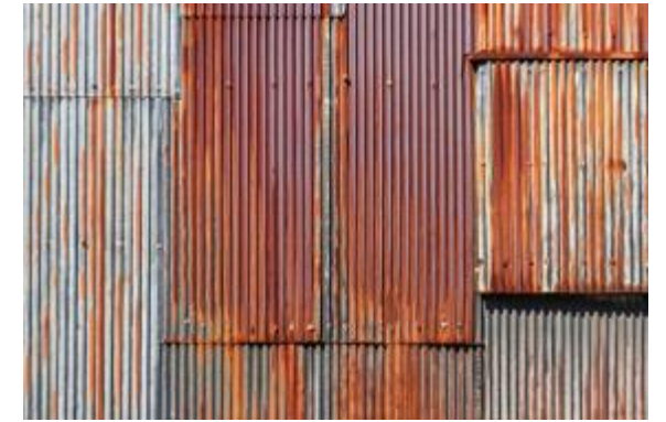
見たことあるでしょう 錆びたトタン

外壁も含め屋外用の金属に安価で強いのが鉄ですが、錆びるのが欠点。そこで鉄を錆びにくくする方法が考案されました。鉄は大気中の酸素で酸化し「錆び」ます。一般的な環境下では二酸化鉄と呼ばれる赤錆になりボロボロになります。そこで鉄板の表面を錫や亜鉛の膜で覆う防錆術が一般化し、錫で覆えばブリキ、亜鉛ならトタンと呼ばれ、街にはブリキ屋さんがあって雨樋を作っていたし、波トタンは外壁によく使われました。