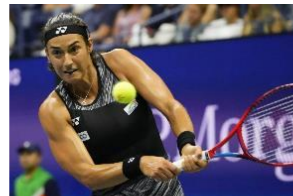
暑いとき頑張れば汗をかく

暑くなると良く言いますが、私には疑問です。人は定温動物なので体芯の温度を一定に保つため暑くなれば血流を増やして手足や体表からの放熱を増やします。それでも追いつかないと次は汗をかいて気化熱で冷やします。そこで水分の補給が必要になりますが、舐めたら分かるように汗は水分だけでなく塩分も排出します。人によって汗の塩分は異なり子供は少なめ、高齢者は多いようです。汗で塩を出して一方で水を飲めばどんどん塩分が失われ体液が薄くなります。すると体は体液を濃くするため余分な水分を捨てようと更に汗を出しますがここで更に塩分を失う。悪循環になってしまいます。