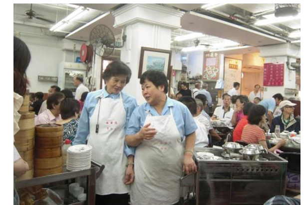
もう行けないか？大繁盛の香港の飲茶レストラン

香港へ行けば日本では味わえない美味しい料理が楽しめます。ガイドさんの案内ではダメですが、規制が緩み航空便も再開したので香港へ遊びに行こうと思い立ち、調べてみたら大変！まず出発前に所定のワクチンを指定回数以上接種した接種証明書を用意します。出発 24 時間以内に抗原検査（RAT 検査）を行いオンラインで「健康・検疫情報申告」をして臨時の「健康申告 QR コード」をダウンロードし、これを空港のチェックインに示すと搭乗ができるようになります。以後ずっとサージカルマスク着用が必須。飛行機を降りたら PCR 検査を受け、結果を待つ事なくイエロー（黄信号）のワクチンパスをダウンロードして入国審査を通過します。翌日、滞在ホテルで RAT 検査をしてネットで報告します。出歩くのは可能です。滞在 2 日目になったら、市街にある PCR 検査場に行って検査を受けます。滞在 3 日目、また抗体検査をして OK の報告をすると朝 9 時にイエローがグリーンに変わります。問題はグリーンに変わるまではレストランで食事をする事が許されません。どうしても食べたければテイクアウトをしてホテルで食べなくてはなりません。またその後も滞在中は毎日ネットで抗体検査報告しなくてはなりません。万一感染したら牢屋かな。冗談じゃないよ、誰がそんなところへ行ってやるもんか！中国支配の恐怖！食べ損なっただちのお奥さんは「よくまあ暴動にならないねー」と言っていました。現実には暴動も起きています。ちなみに欧州、米国、豪州などはワクチン証明も不要です。