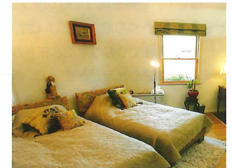
ビニールクロスの上から塗装した部屋

性能化し住み心地が良くなると、家の建て替えの必要性がなくなり「永く住める家」になります。そうすると気分転換に内装壁の改修ニーズが出てきます。欧米人が自分で壁を塗り替えるのはそのせいです。ビニールクロスは容易に張り替えができ、気分一新ができますが、一段と面白いのは塗装です。ビニールクロスの上から塗れる塗料がいろいろな塗料メーカーから販売されています。楽しいので西人みたいに自分で塗ってみませんか？